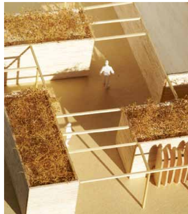
Surfschool The Shore in Scheveningen.