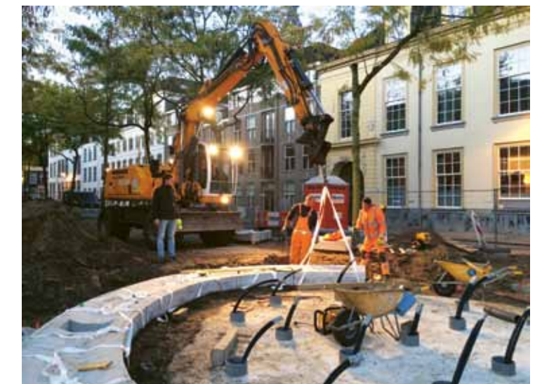
Waterspeelplek Kasteelplein in Breda.

een ontwikkelkader waar het koppelen van verschillend onderwijsprogramma, de transformatie van oude bouwwerken en een flexibel gebruik van de buitenruimte een impuls geven aan een voormalig stedelijk industriegebied. De gezamenlijke noemer in onze plannen is het realiseren van een zintuiglijke ervaring. Poëtisch en tijdloos waarbij het concept tot in detail overeind blijft. Zoals bij de herontwikkeling van een zorglandgoed waar de zintuiglijke ervaring voor de bewoners met een beperking leidend is; bij het creëren van seizoenbeleving door een beplantingsplan voor een plein in een stenig deel van Rotterdam; of de verwijzing naar het gekletter van hoeven door de waterelementen op het Kasteelplein in Breda. Het eindresultaat is altijd fysiek. Daarom is een goede uitvoering net zo cruciaal als een sterk ontwerp. Wij kijken dan ook erg uit naar de aanleg binnenkort van de kade en bouw van de rolbrug over de Vliet in het project Stadsoevers te Roosendaal.'