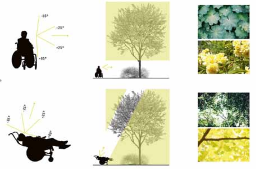
Concept voor de herontwikkeling van een zorglandgoed (i.s.m. met Share urbanism).