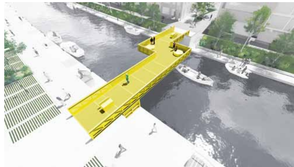
De industriële rolbrug in de nieuwe stadswijk Stadsoevers in Roosendaal.

De NVTL biedt in deze rubriek een podium aan ontwerpers waarin zij zich voorstellen en vertellen hoe zij de nieuwe opgaven waar het vak mee wordt geconfronteerd aanpakken.