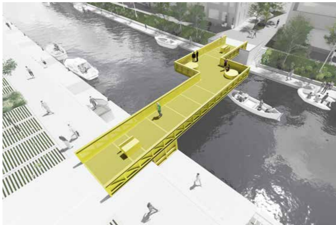
Impressie van de industriële rolbrug in het project Stadsoevers te Roosendaal

De NVTL biedt in deze rubriek een podium ontwerpers waarin zij zich voorstellen en vertellen hoe zij de nieuwe opgaven waar het vak mee wordt geconfronteerd aanpakken