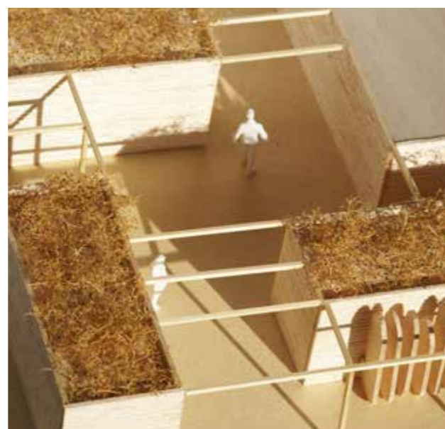
De uitvoering waterspeelplek Kasteelplein te Breda, en maquette van de Surfschool The Shore in Scheveningen